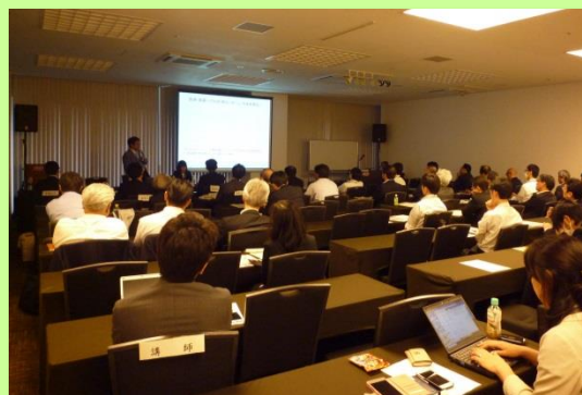
講演会の様子(令和元年度)