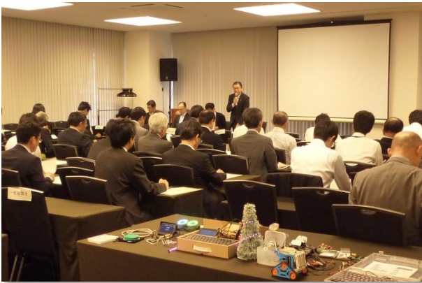
総会での審議(令和元年度)

現在、県では、「みやぎ情報化推進ポリシー(2021～2024)」に掲げた各種の取組を推進しながら、みやぎの高度情報化を目指しています。