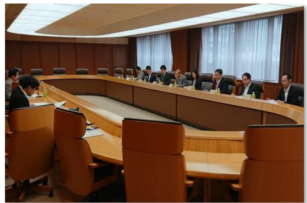
幹事会での意見交換(令和元年度)