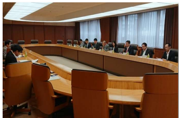
幹事会での意見交換